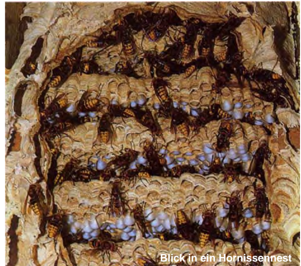
Blick in ein Hornissennest

Seit langer Zeit sind Wespen als Plagegeister und Lästlinge ein Opfer von Vernichtungsaktionen. Dass auch lästige Tiere aus ethischen Gründen ein Lebensrecht genießen, aus ökologischen Gründen (als Teil des Naturhaushalts) schützenswert sind und aus rechtlichen Gründen grundsätzlich gar nicht bekämpft werden dürfen, wird dabei heute häufig nicht bedacht. Rücksichtnahme im Nestbereich, Vorsicht bei der Beobachtung, einfache Vorsichtsmaßnahmen bei Aufenthalt im Freien und vorbeugender Schutz im Haus- und Hofbereich schonen das Leben dieser nützlichen Insekten und ermöglichen meist ein friedliches Nebeneinander. Wer einmal ein Wespen- oder Hornissennest als Kunstgebilde nach dem Verlassen genauer betrachtet, dem eröffnet sich vielleicht ein anderer Blick auf die beeindruckende Lebensweise der Tiere. Vielleicht gelingt es dann, auch wehrhaften und mitunter lästigen Tieren respektvoll und vorsichtig, aber auch vorurteilsfrei und friedfertig zu begegnen.